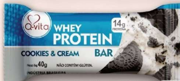
QV1182 - COOKIES + CREAM