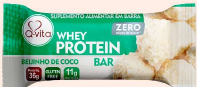
QV1188 - BEIJINHO DE CÔCO