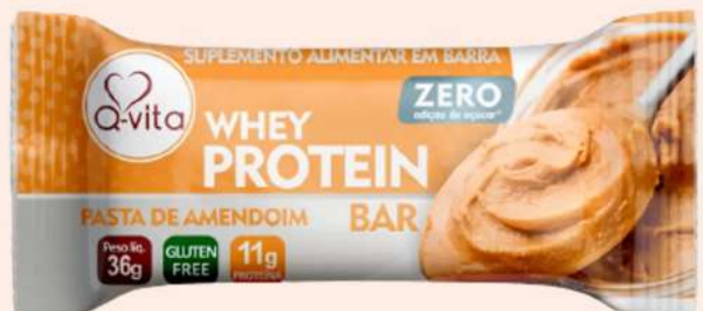
QV1186 - PASTA DE AMENDOIM