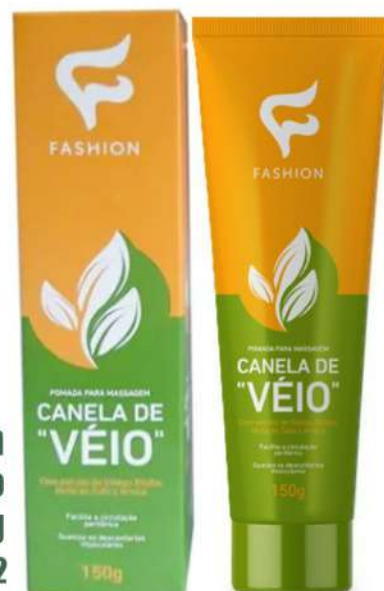
Pomada massagem Canela de Veio 150g Ref. 78100012