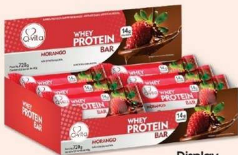
Display com 18 un