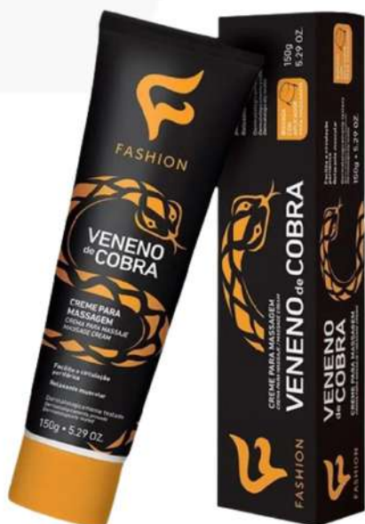
Creme Massageador Veneno de Cobra 150g Ref. 78100001