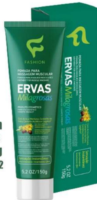
Pomada Massagem Ervas Milagrosas 150g Ref. 78100002