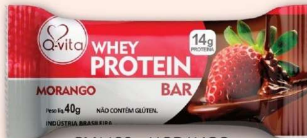
QV1180 - MORANGO