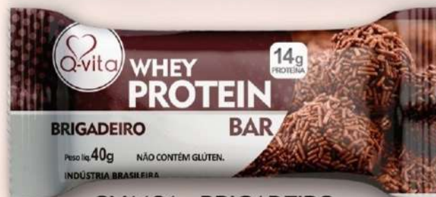
QV1181 - BRIGADEIRO