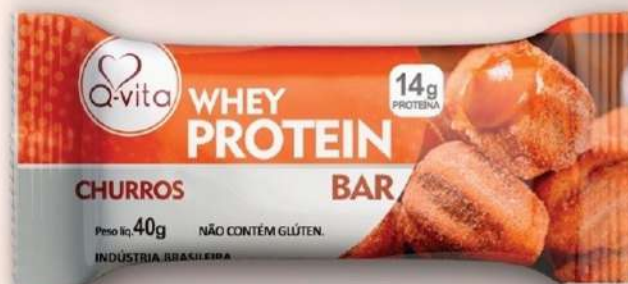
QV1183 - CHURROS