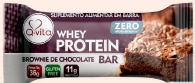
QV1187 - BROWNIE DE CHOCOLATE