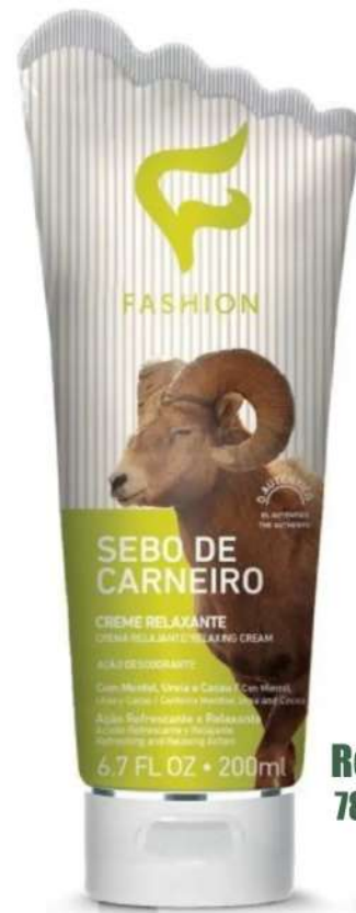
Relaxante 200ml 78090002