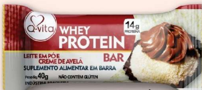
QV1184 - LEITE EM PÓ + CREME DE AVELÃ