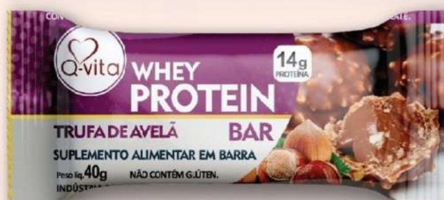
QV1185- TRUFA DE AVELÃ