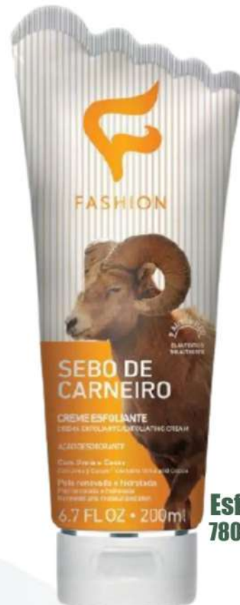
Esfoliante 200ml 78090003