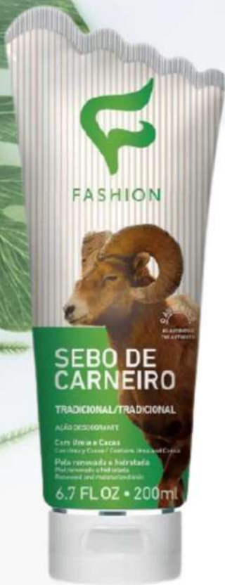
Tradicional 200ml 78090001