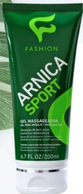
Arnica Sport Massagem Muscular 200ml Ref. 78100004