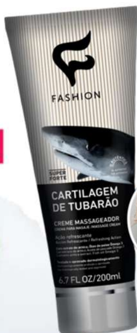
Creme Massageador Cartilagem de Tubarão 200ml Ref. 78100003