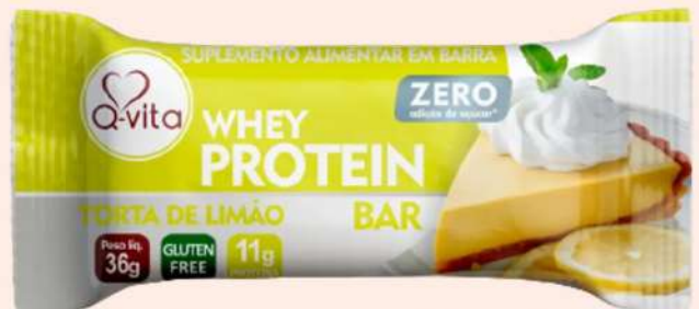
QV1189 - TORTA DE LIMÃO

Barras de proteína com recheio, com ZERO adição de açúcar.