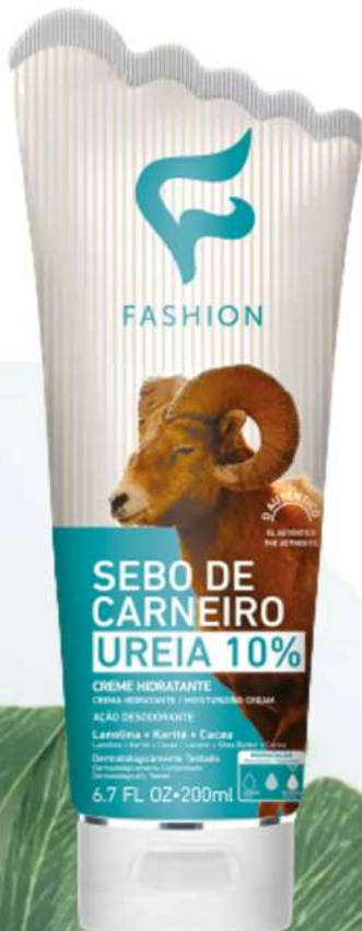
Ureia 10% 200ml 78090005